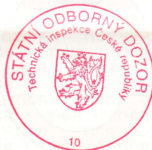
Ing. Robin Profeld vedoucí technického úseku

Toto oprávnění nahrazuje oprávnění ev. č. 12876/6/13/EZ-M,O,R-E2A,E2B